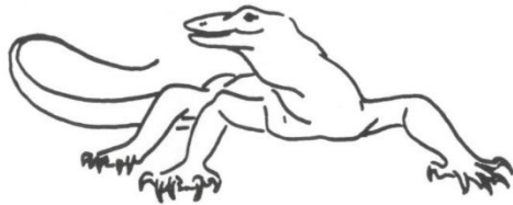
Beispiel: Kommodo Waran